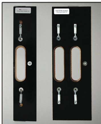
afb. 1 - Freesmal

Er zijn twee varianten te verkrijgen. Een enkele en een dubbele freesmal (afb. 1). Een enkele freesmal is alleen te gebruiken in een sponing van 43 mm of kleiner. Bij een sponing groter dan 43 mm wordt een dubbele freesmal gebruikt. Als het scharnier hoger is dan 95 mm of breder dan 29 mm, dan is deze alleen in een dubbele uitvoering te verkrijgen.