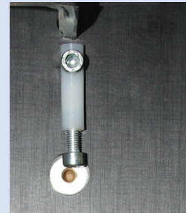
afb. 4 - Zoolbegrenzer naar binnen

Draai de begrenzers naar binnen (afb. 4), dan botst de bovenfrees tegen de begrenzers aan en volgt de ring een kleiner gedeelte, zodat u dat dieper kunt inkrozen. U hoeft de mal niet te verplaatsen (afb. 5 en 6).