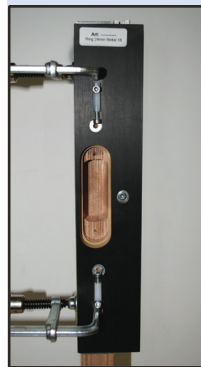
afb. 5 - Mal op deur

De begrenzers zijn instelbaar en daardoor aan te passen aan de zool van ieder type bovenfrees.