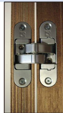
afb. 7 - Resultaat

LET OP! Bij knikscharnieren mag het scharnier niet verdiept liggen in de kozijnstijl. Maak daarom de inkrozing niet te diep!