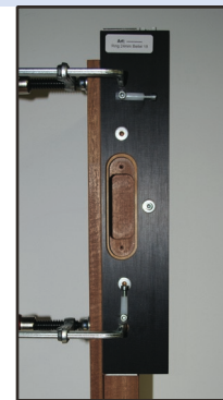
afb. 6 - Mal in kozijn